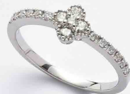
PT900 ダイヤモンド(0.30ct) ¥88,000(税込)