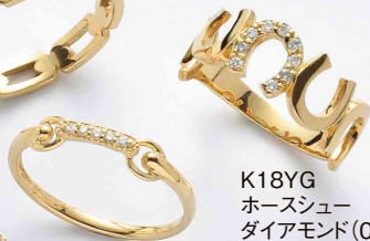
K18YG ホースシュー ダイヤモンド(0.07ct) ¥70,840(税込)